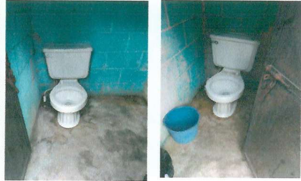
FOTO 2: Mejoramiento de baños, instalación de agua con tubería de P.V.C; pintura, entre otros.