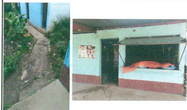
FOTO 4: Instalación de piso granito corredor de cocina y bodega, realización de banqueta para unir los baños.

Observación: Si es necesario se pueden agregar hojas adicionales y actualizar el número de hojas.