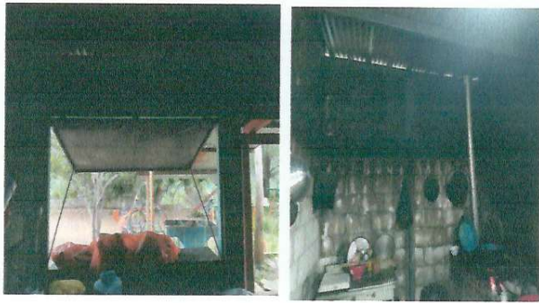
FOTO 1: Mejoramiento de cocina, pintura, cambio de ventana por cortina metálica, cambio de loza por piso de cerámico.