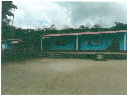
FOTO 3: Instalación de techo con estructura tipo pórtico con cobertura de lámina troquelada calibre 26.